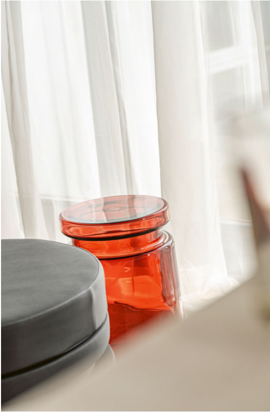
Die ADW verteilt sich auf Locations in der City und ihren Vororten. Links: Hocker von Henry Dean . Unten: Alabasterleuchte „Moon“ aus den Adu Studios . Ganz unten: Dining Chair „Volita“ von Morpho . Rechte Seite: Eingang zum Hotel „Flora“, ein Kleinod.